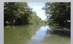
Copyright© Réalisation Communication Evènementiel. Tous droits réservés.

Au calme dans un site de verdure de 10 ha en propriété privée, les étangs du Giboin offrent plaisir et sérénité aux pêcheurs, grâce à ses deux plans d'eau de 3 et 6 ha ainsi que ses berges de Seine régulièrement entretenues et alevinées en poissons blancs et carnassiers par les soins d'une association de pêche.